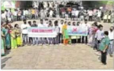
జగంపేట పోలీసు స్టేషన్ వద్ద విద్యార్థుల మానవ హారం

రాజానగరం: గ్రేట్ న్యూరల్ ఆఫ్ ఇండియా మనవన యూనిట్ ఆధ్వర్యంలో రాజానగరంలో బుధవారం ఎయిడ్స్ పై అవగాహన ర్యాలీ నిర్వహించారు.