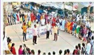
సీతానగరంలో డిగ్రీ విద్యార్థుల మానవహారం